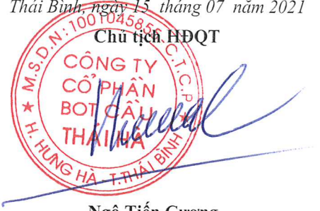
Ngô Tiến Cường