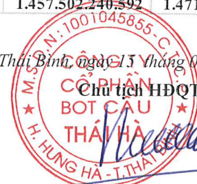
Ngô Tiến Cường